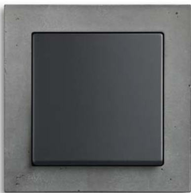
Busch-axcent® pur beton, Wippe schwarz

Auch bei dem Programm carat® ist Busch-Jaeger einmal mehr Vorreiter, was den Einsatz neuer, exklusiver Materialien für die Gestaltung von Schaltersystemen betrifft.