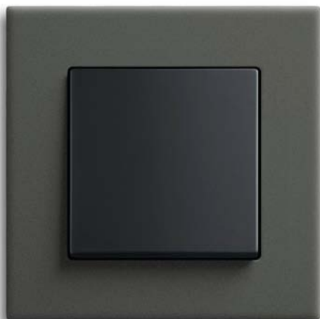
carat® Ceramic, Wippe schwarz

Postfach 58505 Lüdenscheid Telefon: 02351 956-0 Telefax: 02351 956-9754 www.BUSCH-JAEGER.de