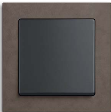
Busch-axcent® pur papierbraun, Wippe schwarz