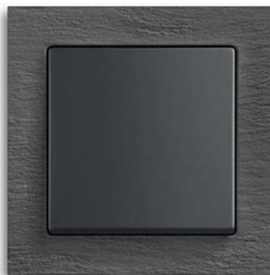
Busch-axcent® pur schiefer, Wippe schwarz