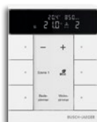
Raumtemperaturregler mit Display, 5/10-fach Bedienelement