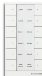
Raumtemperaturregler ohne Display, 6/12-fach Bedienelement