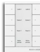
Raumtemperaturregler ohne Display, 4/8-fach Bedienelement