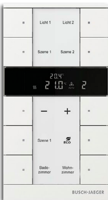
Raumtemperaturregler mit Display, 5/10-fach Bedienelement