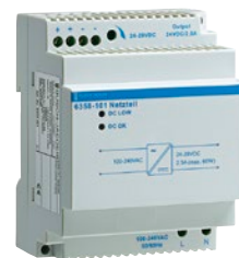
Netzteil, REG 2500 mA SELV Maße (H x B x T): 90 mm x 72 mm x 64 mm Einbautiefe: 68 mm