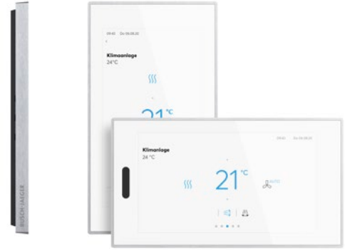
IP touch 7, weiß