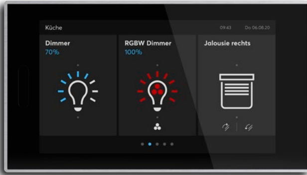
IP touch 7, schwarz