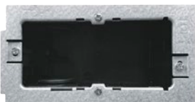
Unterputz-Montagedose Einbaumaß Unterputz (H x B x T): 121 mm x 58 mm x 50 mm.