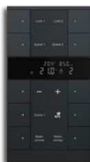
10-fach RTR & CO 2 /Feuchte 2