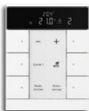
6-fach RTR & CO 2 /Feuchte 2

Für die eindeutige Bezeichnung der Busch-Tenton® Bedienelemente steht Ihnen online ein Beschriftungs-Tool zu Verfügung, mit dem Sie beliebigen Text sowie instruktive Symbole individuell für jedes Produkt platzieren können. Wobei die jeweilige Größe aus vorgeschlagenen Werten frei wählbar ist. Ihre Eingaben werden so angezeigt, wie sie später auf dem Gerät zu sehen sind. Und dies wahlweise auf Folie in mattschwarz mit weißer sowie in alusilber oder studioweiß mit schwarzer Bedruckung.