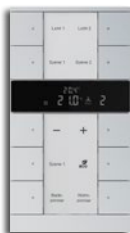
10-fach RTR-Slave 1