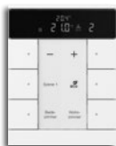
6-fach RTR-Slave 1