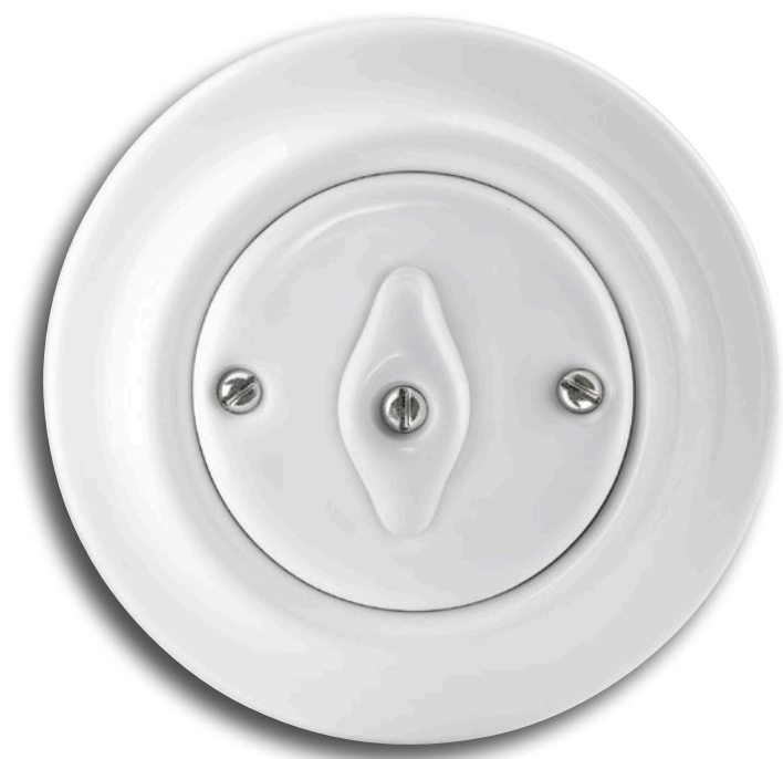
01 | NEU