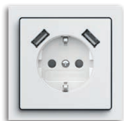
SCHUKO® USB-STECKDOSE SAFETY+, 2-FACH 2 X USB-A 2,4A

Altijd in beeld. Voor iedereen die weleens zijn mobiele telefoon kwijt is, biedt powerDock uitkomst. Het laad-station biedt een vaste plaats en doordat de mobiele telefoon rechtop staat, zijn nieuwe notificaties altijd meteen zichtbaar. Daarnaast bieden de powerDock-laders een snellaadfunctie en intelligent laadbeheer.