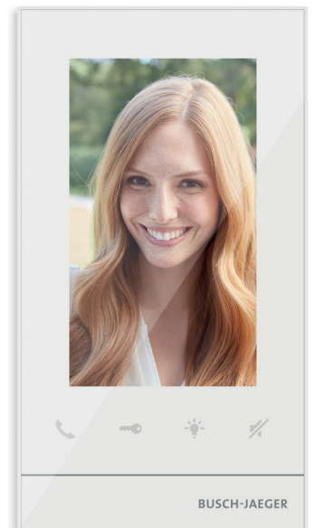
Innenstation Video 5"