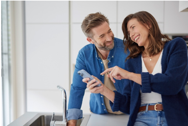
Foto: Der System Access Point 3.0 ist das Herzstück des Smart-Home-Systems Busch-free@home®. Er vernetzt alle Komponenten zuverlässig und ermöglicht die einfache Steuerung des Zuhauses per App.