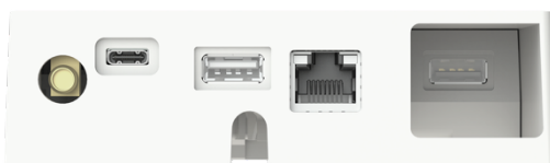
Foto: An der Unterseite des neuen System Access Point 3.0 befinden sich der optionale Busch-free@home® wireless Antennenanschluss, die USB-C-Spannungsversorgung, zwei USB-A-Ports, davon ein versenkter, sowie eine RJ45-LAN-Anschlussbuchse.

Foto: Der neue System Access Point 3.0 überzeugt durch sein optimiertes Design, seine LED-Statusanzeige und seinen komplett überarbeiteten Aufbau, der deutlich mehr Flexibilität bietet.