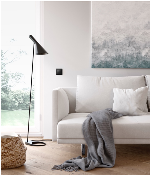
Foto: Stilvoller Auftritt im Raum: Busch-balance® SI in Schwarz matt fügt sich harmonisch in moderne Interieurs ein.

Foto: Zwei Farben, ein Designprinzip: Busch-balance® SI in Alpinweiß und Schwarz matt stehen für stilvolle Kontraste und harmonische Integration in jede Architektur.