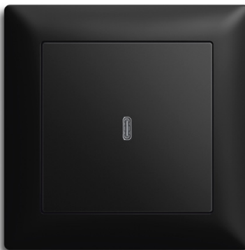
Foto: Volle Ladeleistung direkt aus der Wand: Das USB-C-Power-Netzteil mit 65 Watt im Design der Serie Busch-balance® SI in Schwarz matt.