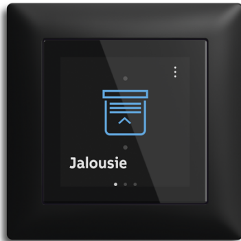
Foto: Brillanz trifft Tiefenschärfe: Im Rahmen Busch-Balance® SI Schwarz matt wirkt das Busch-Trevion® Display besonders kontrastreich und setzt visuelle Akzente.