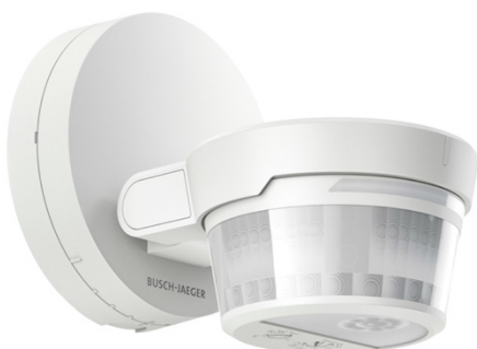
Bild: Der neue Busch-Wächter® PRO KNX sorgt für automatisches Licht, zeigt Sicherheitszustände per RGB-LED sichtbar an und ermöglicht eine flexible Steuerung per App.

„Mit dem Busch-Wächter® PRO KNX verbinden wir die bewährte Qualität unserer Bewegungsmelder mit den Möglichkeiten moderner KNX-Technologie – für mehr Sicherheit, mehr Komfort und mehr Gestaltungsfreiheit“, sagt Thomas Kwiaton, Produkt-Marketing Installationsprodukte und Systeme bei ABB und Busch-Jaeger. Ob im privaten Smart Home oder im gewerblichen Objekt – der Busch-Wächter® PRO KNX bringt leistungsstarke KNX-Intelligenz dorthin, wo sie gebraucht wird: zuverlässig, flexibel und zukunftssicher – entwickelt und gefertigt in Deutschland.