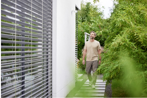
Bild: Die neueste Generation intelligenter Bewegungsmelder ist mit dem Busch-Wächter® PRO nun auch für KNX verfügbar.