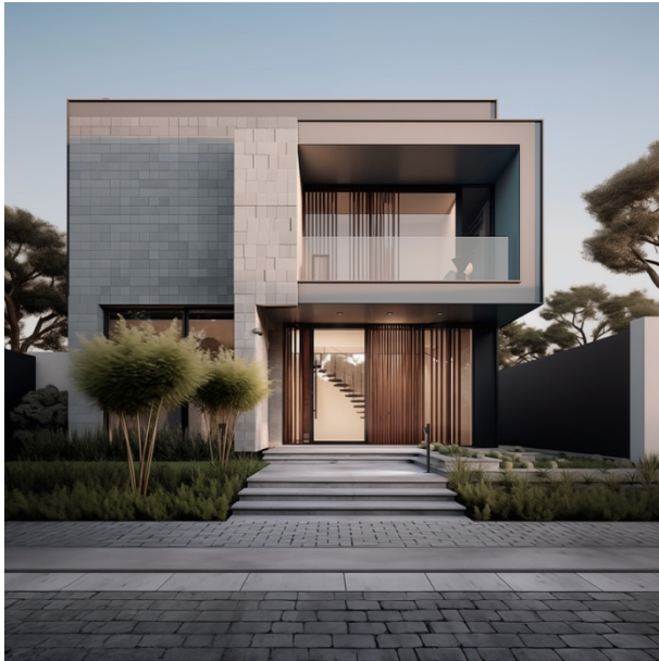
Bild: Design trifft Intelligenz: Der Busch-Wächter® PRO KNX verbindet Licht, Sicherheit und maximale Flexibilität.