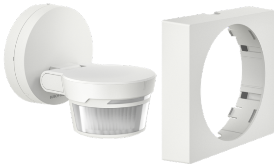
Bild: Der Busch-Wächter® Pro bietet flexible Designoptionen. Der optionale, eckige Designrahmen lässt sich mühelos über den Wächterkopf stecken und wird am runden Sockel gerastet.