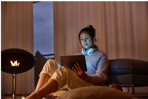
Bild: Die neuen Raumtemperaturregler von Busch-Jaeger sorgen in jeder Umgebung für das perfekte Raumklima.

Die neuen Raumtemperaturregler von Busch-Jaeger zeichnen sich durch ihre einfache Bedienung aus, sei es über intuitive Drehregler oder moderne Touchdisplays. Sie lassen sich flexibel als Stand-alone-Lösung ohne Systemanbindung oder in Kombination mit Busch-flexTronics® einsetzen. Sie eignen sich besonders für Mietwohnungen, da sie eine smarte, aber wartungsarme Lösung darstellen. Die Möglichkeit der Steuerung per App oder durch vernetzte Bedienung ermöglicht optimierte Heizzeiten und fördert die Energieeffizienz. Für Nutzer, die eine umfassende Hausautomation wünschen, ist mit den Raumtemperaturreglern wireless eine optionale Erweiterung mit Busch-free@home® möglich. Die neuen Raumtemperaturregler sind ab sofort erhältlich. Sie bieten den idealen Einstieg in die digitale Heizungssteuerung, von der einfachen Einzellösung bis hin zum intelligent vernetzten Smart-Home-System.