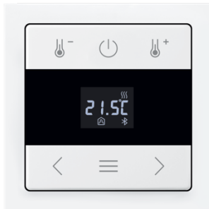
Bild: Der Raumtemperaturregler Bluetooth mit Touchdisplay ist eine Stand-alone-Lösung mit mehr Funktionen, die manuell oder per App gesteuert werden können.

Bild: Der Raumtemperaturregler mit Drehbedienung eignet sich durch seine einfache und intuitive Bedienung für den klassischen Wohnbau.