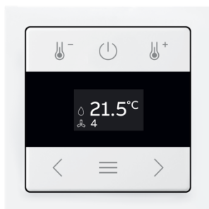
Bild: Der smarte Raumtemperaturregler wireless mit hochauflösendem Touchdisplay bietet eine vernetzbare Lösung mit Busch-flexTronics® und dem Smart-Home-System Busch-free@home®.

Bild: Der Raumtemperaturregler Bluetooth mit Touchdisplay ist eine Stand-alone-Lösung mit mehr Funktionen, die manuell oder per App gesteuert werden können.