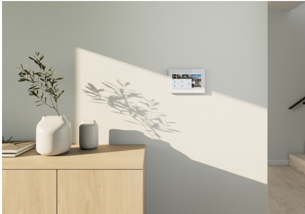
Bild: Das neue Busch-OneTouch 7 unterstützt die Integration Matter-fähiger Produkte.