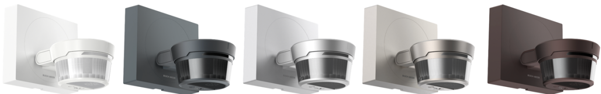
Bild: Durch den neuen eckigen Designrahmen passt sich der Busch-Wächter® PRO der Hausarchitektur an. Auch die große Farbauswahl im bewährten Weiß und den neuen Tönen in Anthrazit, Silber, Edelstahl und Dunkelbraun (von links) bietet Vielfalt.