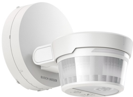
Bild: Der neue Busch-Wächter® PRO ist der Wächter für alle Anwendungsbereiche, Montageorte, Designoptionen und Wetterlagen.