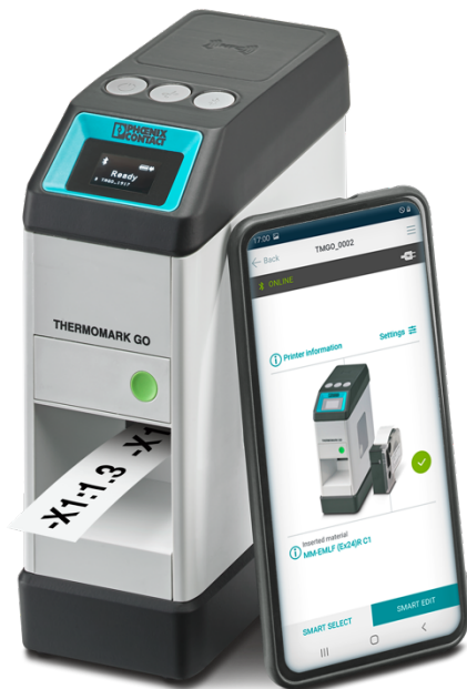
Bild: Mit Hilfe des THERMOMARK GO und der MARKING system App von Phoenix Contact können die Produkte von Busch-Jaeger schnell und einfach beschriftet werden.