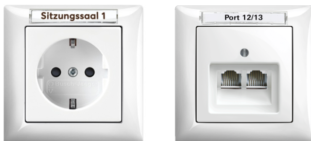
Bild: Die verfügbaren Größen der Beschriftungsbänder ermöglichen passgenaue Labels für Steck- und Datendosen von Busch-Jaeger. Mit Hilfe des Klebefilms können diese einfach in der passenden Nut angebracht werden.