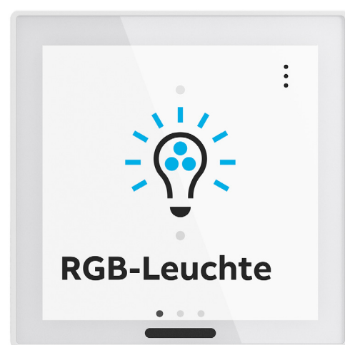
Bild: Busch-RoomTouch® 4" überzeugt durch die kapazitive Glasoberfläche mit einer guten Bedienbarkeit von beispielsweise RGBW-Leuchten