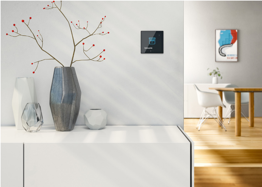
Bild: Durch ein modernes und flaches Design passt sich der neue Busch-RoomTouch® 4" perfekt in jede Umgebung ein.

Postfach 58505 Lüdenscheid Telefon: 02351 956-0 Telefax: 02351 956-9751 www.BUSCH-JAEGER.de