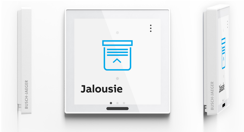
Bild: Busch-RoomTouch® 4" erfüllt alle Anforderungen an ein modern gestaltetes Gerät, erstklassige Qualität und vor allem echtes Material in flachem Design.

Postfach 58505 Lüdenscheid Telefon: 02351 956-0 Telefax: 02351 956-9751 www.BUSCH-JAEGER.de