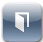
Welcome do myBUSCH-JAEGER

Otworzyć aplikację i wpisać dane dostępu do portalu myBUSCH-JAEGER. Naciśnięcie przycisku "login" łączy bramę sieciową IP z portalem.