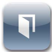
Welcome pour myBUSCH-JAEGER

Ouvrez l'application et entrez les données d'accès au portail myBUSCH-JAEGER. Si vous appuyez sur la touche Login , vous connectez l'application au portail.