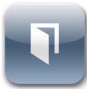
Welcome für myBUSCH-JAEGER

Öffnen Sie die App und tragen Sie die Zugangsdaten zum myBUSCH-JAEGER Portal ein. Durch betätigen der Taste Login ist die App mit dem Portal verbunden.