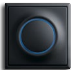
impuls schwarz matt