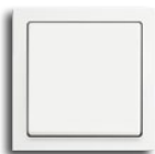
future® linear studioweiß matt